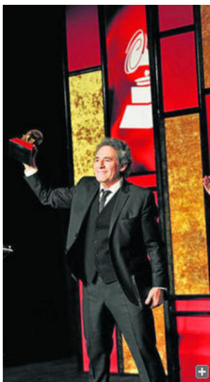
Miguel Ríos, en Las Vegas, al recibir su Grammy.

Los primeros galardonados de la noche en la gala previa fueron la cantante mexicana Natalia Lafourcade y la agrupación Bajofondo. La banda radicada en Río de la Plata obtuvo un gramófono por mejor álbum instrumental por Presente y mejor canción alternativa por Pena en mi corazón . Por su parte, la intérprete de "En el 2001" recibió dos trofeos por su homenaje a Agustín Lara con Mujer Divina en las categorías de álbum de música alternativa y mejor video musical versión largo. Otros artistas galardonados fueron Andrés Cepeda por Lo mejor que hay en mi vida en la categoría de mejor álbum vocal pop tradicional. La española Mala Rodríguez ganó una distinción por Bruja en la opción de mejor álbum de música urbana.